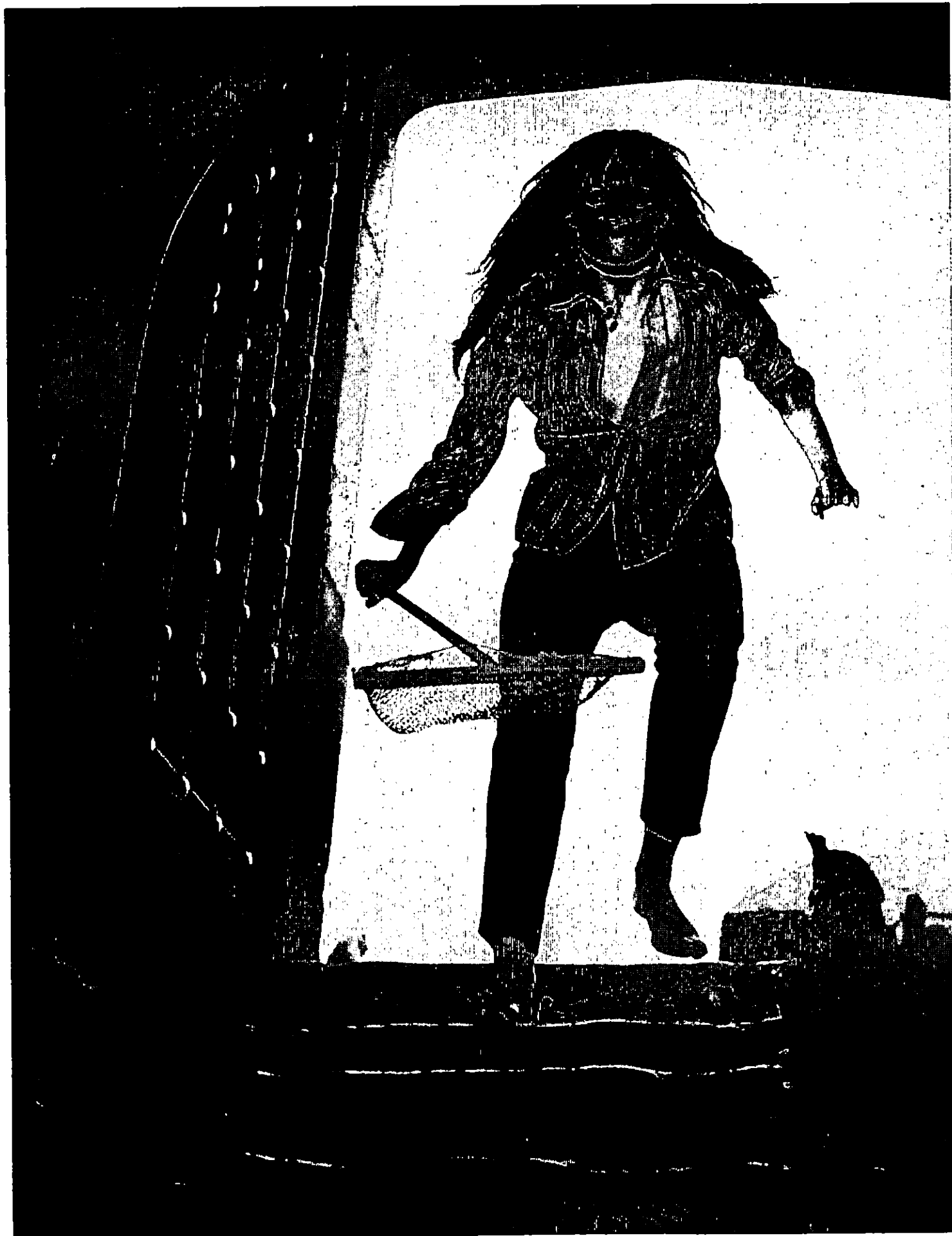
FRANÇOISE DORLEAC DANS « CUL-DE-SAC ».